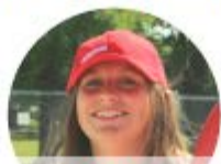
DANA SAUVETEUR NATIONAL