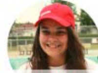
KORALY SAUVETEUR NATIONAL