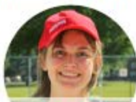
ALICIA SAUVETEUR NATIONAL

L'équipe aquatique est une brigade de 5 surveillants-sauveteurs certifiés. Elles assurent la sécurité des baigneurs et animent les cours de natation.